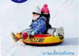
ลานเลื่อนพิเศษ

เสียเฉพาะค่าเช่าเท่านั้น ※กรณีที่มัลิก้าอาจมีการขอให้สลับกันเล่นกับลูกค้าท่านอื่น แม้ว่าจะยังอยู่ภายในเวลาที่ตาม