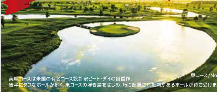
美唄コースは米国の有名コース設計家ビート・ダイの自信作。後半にタフなホールが多く、東コースの浮き島をはじめ、巧に配置された湖があるホールが待ち受けます。